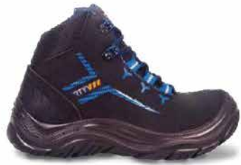
/// MODELO THOR HANKOOK

Algunos de nuestros productos son los siguientes: