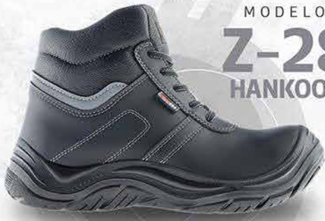
MODELO Z-28 HANKOOK