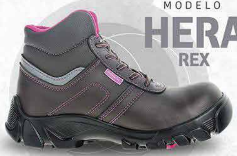
MODELO HERA REX

CORTE Micropiel de alta resistencia al desgarre, abrasión y flexión, ecológico e hidrofugado con 24 horas de hidrólisis.