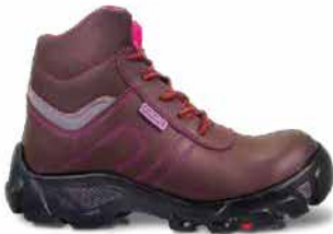
/// MODELO HERA REX