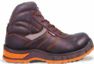
/// MODELO TITANIUM IRON