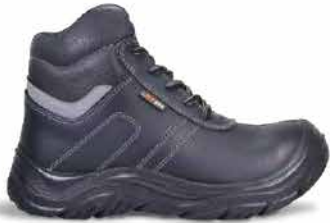
/// MODELO Z28 HANKOOK