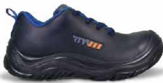
/// MODELO COSMO HANKOOK

Algunos clientes actuales se encuentran en las siguientes industrias: Metalmecánica, manufactura, automotriz, aeroespacial, petroquímica, construcción, hotelería, alimenticia, laboratorios, textiles, acerías, entre otros.